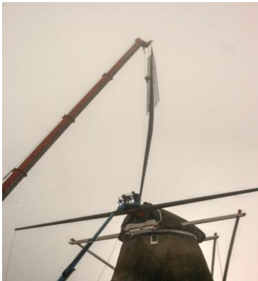
Het verwijderen van de wieken

Zaterdag, 25 februari was het dan zover, de molen werd stilgezet. Voor de laatste keer draaiden de 50 jaar oude wieken. Het stilleggen van de molen werd met gejuich ontvangen, het was immers de start van de heropbouw van de molen. De zeilen werden verwijderd opgevouwen en opgeruimd. Nog een keer de spil eruit gehaald. Op 9 maart zijn de beide stalen roeden (1 roede is een lange stalen koker van 23 meter en is gelijk aan 2 wieken) verwijderd met een hoogwerker, een spectaculair gezicht vooral het optillen van de 23 meter lange roede was heel bijzonder om te zien! Ook de lange spruit, een lange horizontale houten balk welke dwars door de kap loopt en de staartbalk zijn er uit gehaald.