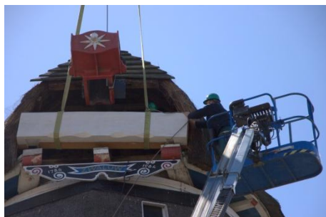
Plaatsen van de windpeluw

Naast de molen kreeg ook Het Pakhuis een opknapbeurt. De vrijwilligers plaatsten o.a. een glazen halletje bij de trapopgang en in de achtergevel werden de ramen, die er vroeger hebben gezeten, teruggeplaatst.