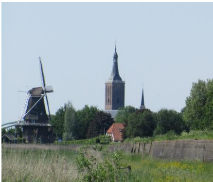
De mooiste skyline van Hasselt

Een al langer gekoesterde wens is in vervulling gegaan; er is een officiële fietsroute langs de molen! Bij een bijeenkomst van de IJsseldelta kwam deze wens naar voren. De coördinator van de ANWB adviseerde om de plaatselijke ANWB-consul Wim Reuvekamp te benaderen met het verzoek om een fietsroute te ontwerpen. De route is er gekomen maar het verzoek om deze op te nemen in de ANWB-routeboekjes werd helaas niet gehonoreerd omdat men in de regio Zwolle al voldoende routes heeft. Bovendien kost het extra capaciteit om nieuwe routes jaarlijks te controleren, zo was door de toeristenbond in de afwijzingsbrief aangevoerd. Het bestuur van De Zwaluw heeft toen besloten om de door de consul ontworpen route in eigen beheer uit te geven. Er ligt nu een fraai uitgevoerde en informatieve route klaar voor de fietsliefhebbers onder de naam "Stenendijk-route". Zoals bekend is de Stenendijk de enige overgebleven gemetselde zeevering in Nederland. De fietsroute van 30 kilometer is gratis verkrijgbaar in Hasselt bij Grand Café De Linde, het TIP, de Werkplaats en in Zwolle bij Hotel Van der Valk en Camping de Agnietenberg. En natuurlijk ligt de nieuwe route bij korenmolen De Zwaluw aan de Stenendijk.