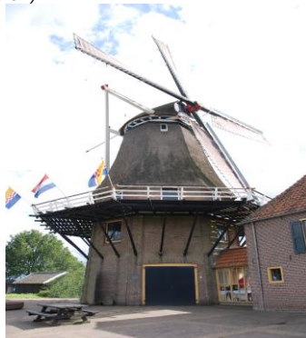
Een mooi voorbeeld van een stellingmolen

Aan de horizon van het Nederlandse landschap zag men eeuwenlang in alle windrichtingen wel een molen. Op heel oude schilderingen staan ze al afgebeeld. Molens werden gebouwd om de drijfkracht te leveren voor het werk dat in die molens plaatsvond. Zolang de mensheid graan verbouwt voor voedsel, bestaat er behoefte om graan tot meel te verwerken. Eeuwenlang deed men dit met primitieve hulpmiddelen door middel van hand- en lichaamskracht, later door rosmolens (met paardenkracht dus). In een later stadium ontstond de windmolen die in ons vlakke, winderige land veel opgang deed. Er zijn twee soorten molens: de watermolen die door waterkracht in beweging wordt gezet en de windmolens die door de wind worden aangedreven. Als zich in de nabijheid van de plaats waar men een molen wilde bouwen, obstakels bevonden in de vorm van opgaande gebouwen en bomen, dan maakte men de molen zo hoog dat zij zo min mogelijk windbelemmering ondervond. Om toch de zeilen te kunnen voorleggen en te zwichten (minderen), te kruien (in de wind zetten) en de vang (rem) te kunnen bedienen, werd er rondom de molen een platform (stelling) aangebracht. Het onderliggende gedeelte werd meestal als extra opslagplaats gebruikt. Dit type molen is door de hoogte en de stelling gemakkelijk te herkennen. (met dank aan de Hollandse Molen ).