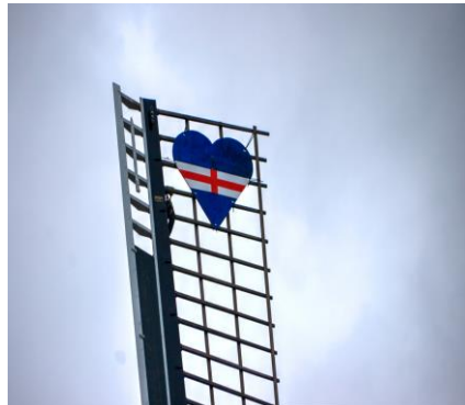
Het hart in de wieken