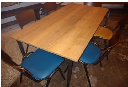
Eén van de vier nieuwe tafels.

€ 1.771,09, een prachtig bedrag! Wat zijn er toch veel mensen die de molen een warm hart toedragen! De bestemming was dit keer nieuwe stapelbare tafels voor in de molen. Bij elke verhuur of trouwerij moet de opstelling van de tafels aangepast worden door onze vrijwilligers. Nu de zware eikenhouten tafels vervangen zijn door de nieuwe lichtere tafels is dat geen probleem meer.