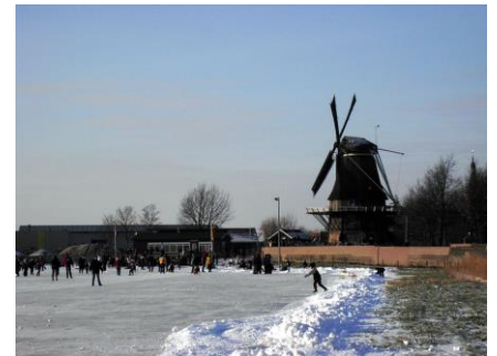
Een winters plaatje

De meteorologen voorspellen een strenge winter, zou het dan toch weer mogelijk zijn?