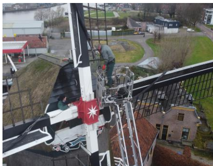
Het plaatsen van het stormschild

Er is altijd onderhoud nodig bij een monumentaal pand als De Zwaluw. Nu was het stormschild aan vervanging toe. Vaags Molenwerken heeft het nieuwe stormschild geplaatst. De winterstormen kunnen komen!