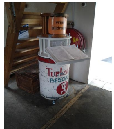
en de nieuwe