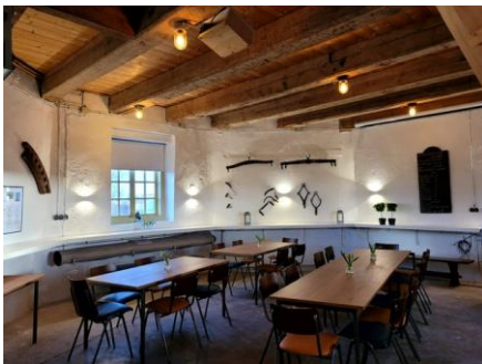
Het nieuwe interieur

In de voorgaande maanden heeft het interieur van de molen een ware metamorfose ondergaan. Door de jaren heen hadden steeds meer attributen hun weg gevonden naar de muren van de molen; deze waren niet altijd gerelateerd aan de molen. In goed overleg is er een schifting gemaakt van wat wel en niet met de molen te maken heeft. De muren zijn opnieuw gesaust en er is mooie indirecte verlichting gekomen. Het resultaat mag er zijn. En dit allemaal gerealiseerd door de vaste groep vrijwilligers. Op het laatst moest er nog even flink doorgewerkt worden in verband met een gepland huwelijk op twee februari. En het is gelukt! Samen met de nieuwe tafels en stoelen heeft de molen een frisse uitstraling gekregen.