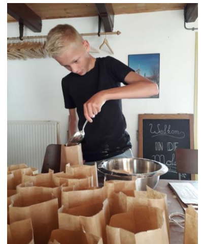
Een uiterst precies werkje!

Tijdens Molen- en Monumentendagen genieten veel bezoekers van de heerlijke pannenkoeken en een lekker plakje kruidkoek. De kruidkoekmix en het pannenkoekenmeel zijn afkomstig van Molen De Weert in Meppel. Onze molen is weliswaar maalvaardig maar kan niet aan de hygiënevoorschriften voldoen, daarvoor zou iedere dag gemaal moeten worden. De molenaars van De Zwaluw malen iedere zaterdagmiddag maar alleen om een demonstratie te geven van het maalproces. Regelmatig worden er dus grote zakken pannenkoekmeel en kruidkoekmix gehaald in Meppel die vervolgens in zakjes met het logo van de Zwaluw worden gedaan. Een hele klus; dit jaar zijn er 440 zakjes pannenkoekmeel en 110 zakjes kruidkoekmeel gevuld. Alle hulp is dan welkom zelfs de kleinkinderen van bestuursleden helpen regelmatig.