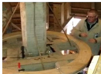
De nieuwe luitafel