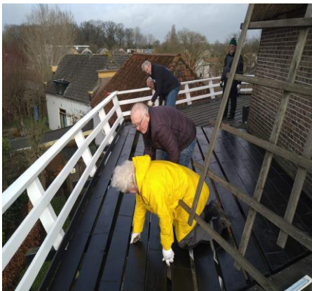
Het plaatsen van de nieuwe planken