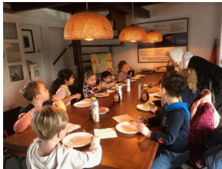
Smullen van de pannenkoeken

Maar liefst 254 kinderen uit groep één en twee van de scholen uit Hasselt en omgeving kwamen dit jaar naar de molen in het kader van het project Molenmuis. Op school was hier al aandacht aan besteed dus de jonge leerlingen kwamen goed beslagen ten ijs. Op het Molenplein werden ze welkom geheten door de vrouw van de molenaar. Binnen werd de groep in tweeën gesplitst en ging de ene helft met de molenaar naar de molen en de andere kinderen gingen met de vrouw van de molenaar naar de film over het ondeugende (molen)muisje kijken. Daarna was het de tijd voor de pannenkoeken en een glaasje limonade en kon er nog een kleurplaat gemaakt worden. Deze moest als voorbeeld dienen voor de nieuwe kleuren van de molen, want de molenaarsvrouw wilde wel eens wat anders dan altijd maar dat saaie groen en wit. Toen de kleurplaat klaar was en de pannenkoeken waren opgegeten gingen de groepen wisselen.